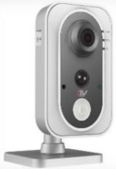
LTV CNM-320 C1 2 штуки