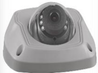
LTV CNM-825 41 2 штуки